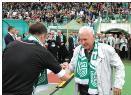
Аплодисменти от публиката на юбилейния мач "100 години Светът е Берое"

където изучавах двигателя и целия корпус на танка. Така се сдобих и със свидетелство за управление на най-тежката верижна машина.