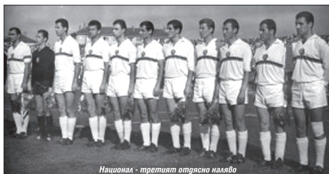
Национал - третият отлясно наляво

- състоя се на 29 декември 1965 година. Бяхме в квалификационна група с Бел-