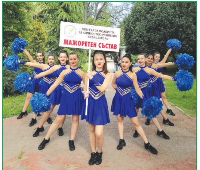
Мажоретният състав към Центъра за подкрепа за личностното развитие в Стара Загора преди дни се забърна с първи награди от фестивалите във Велико Търново и Шумен