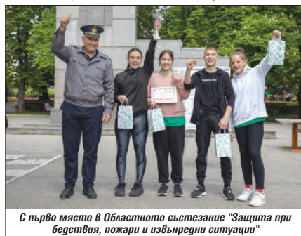
С първо място в Областното състезание "Защита при бедствия, пожари и извънредни ситуации"