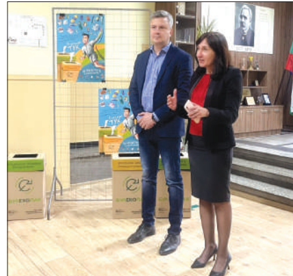
Представянето на инициативата за поставяне на контейнери за разделно събиране във Второ основно училище "П. Р. Славейков"

И в другите кампании тази година има увеличаване на хората, които се включват в тях. Преди дни премина тази за разделно събиране на опасни отпадъци,