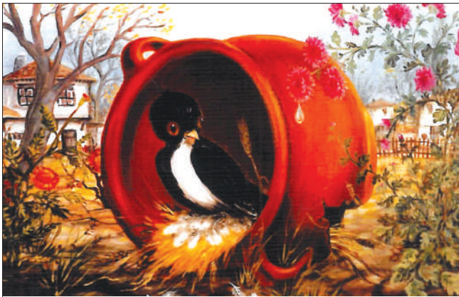
По тази илюстрация ще бъде изработено мозаечното пано в подлеза пред Регионална библиотека "Захарий Княжески"