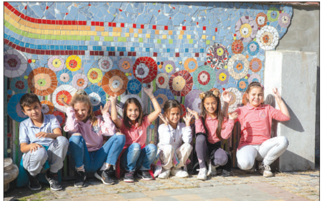
Проектът "Деца - цветята на града", в който повече от 1000 деца изработиха пано, разположено в парк "Артилерийски"