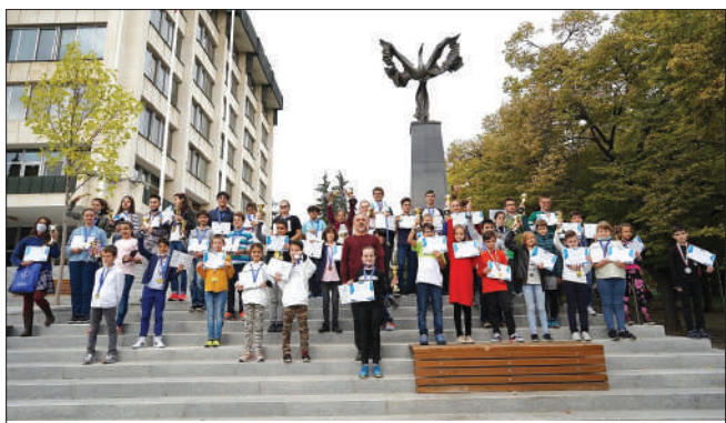
През 2020 г. Българските шампиони от Азия оупън получиха своите купи в Стара Загора

Младите старозагорски математици започват своите изяви на 3 юни, когато в Стара Загора ще се проведе финалът на клуб "Математически таланти". След това предстои надпревара сред хилядна конкуренция - на 1 юли в Несебър, където ще се проведе 10-ият финал на "Математика без граници". Сред 1000 участници са и 20 ученици от Стара Загора. В средата на юли в столицата на Южна Корея - Сеул, предстои финалът на World Mathematics Invitational, в който България ще участва за 5-и път. А през месец август българските участници за 10-и пореден път ще мерят сили в AIMO в столицата на Малайзия -