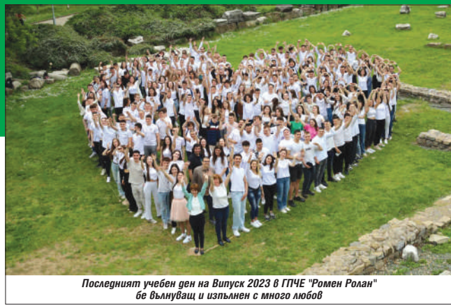
Последният учебен ден на Випуск 2023 в ГПЧЕ "Ромен Ролан" бе вънлувац и изпълнен с много любов

Тази година Стара Загора изпраща 1217 абитуриенти. На всички тях желаем сбъднати мечти!