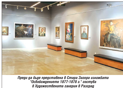
Преди да бъде представена в Стара Загора изложбата "Освобождението 1877-1878 г." воступа в Художествената галерия в Разраг

- Не предвиждаме официално откриване. Още от 1 март ще бъде достъпна за публиката. В рамките на 10 дни всеки може да я разгледа. Благодарност отново за парк-музей "Шипка-Бузлуджа", който предостави част от своите произведения!