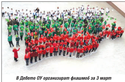
В Девето ОУ организират флашмоб за 3 март

часовете по изобразително изкуство. Възпитаниците на СУ "Железник" ще бъдат и сред ентузиастичната публика на междуучилищната викторина "1000 причини да се гордеем, че сме българи". Родолубиви-