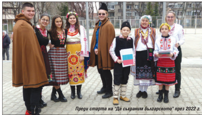
Преди старта на "Да съхраним българското" през 2022 г.

Радваме се, че към училищните инициативи приобщаваме и семействата на нашите възпитаници. Те участват активно и в благотворителните кампании на ученическия парламент. Нашите ученици опознават чужди езици и култури, но най-важно за нас е възпитанието в патриотизъм, българщина, семейственост. Като българи имаме много поводи за гордост, но въпреки че са нужни сериозни усилия - винаги надграждаме - с поглед напред и с полет, казват още от екипа на СУ "Максим Горки".