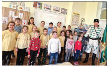
В ОУ "Георги Райчев" патриотичните инициативи стартираха преди дни