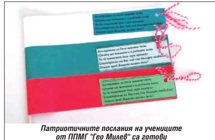
Патриотичните послания на учениците от ППМГ "Гео Милев" са готови

Представители на ученическият съвет на Девето ОУ ще изготвят презентация на тема "България отново гордо и свободно заблестя!", която ще бъде представена от училищната телевизия "IX ОУ - ТВ". А репортерите на школската