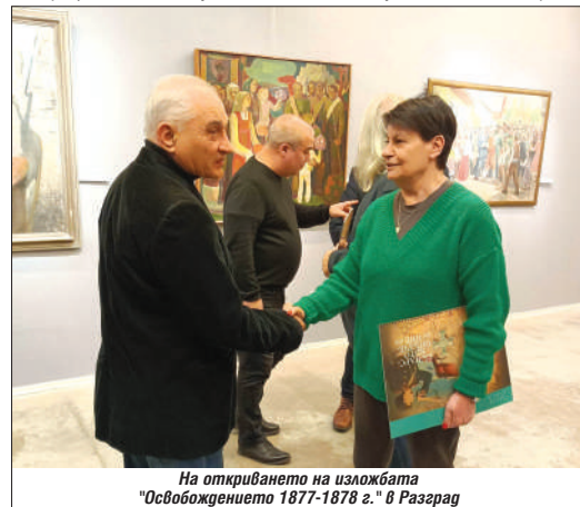
На откриването на изложбата "Освобождението 1877-1878 г." в Разраг

Ако в една или друга галерия се направи изложба на Владимир Димитров-Майстора, Злато Бояджиев, Стоян Венев или други популярни художници, ще има много публика. Само че мислята на една художествена галерия е