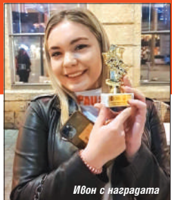
Ивон с наградата

Маратон Стара Загора приветства всички доброволци, желаещи да вземат участие в уникалното спортно събитие. Търсят се мотивирани, всеотдайни и грижовни личности, които да бъдат в помощ на състезателите. Задачата им ще бъде да раздават стартовите пакети, да са част от подкрепителните пунктове, да помагат при маркиране на трасето и да следят за спазване на правилата от участниците и други съпътстващи събитията дейности. Всеки, на възраст между 14 и 60 години, желаещ да бъде доброволец, може да остави име и телефон за връзка на е-мил: starazagoramathon@ab.bg .