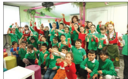
В ОУ "Кирил Христов" са готови и за Баба Марта

ма: "Моята България". Четвъртокласниците ще посетят Регионален исторически музей-Стара Загора. В час на класа ще се проведат беседи, презентации и работа с работни листове, които ще запечатат знанията на учениците. Учениците от 5 А и 5 Б клас ще включат в общоградския ритуал за поднасяне на венци и цветя в парк "Петри октомври", а от 11.00 часа, заедно със своите родители, ще участват в паметното шествие "За свободата..... да развеем българс-