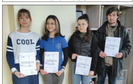
Ученици от НГПВМ "Иван Павлов" бяха отличени за участие в конкурс, посветен на Васил Левски

съдържа стихотворения, посветени на празника, виртуална разходка на храм-паметника Шипка, филм с информация как се е отбелязвал националният празник през годините, презентация по темата. Всички QR кодове бяха поставени още на 27 февруари на възлови места из сградата на училището и достъп до тях ще имат ученици, учители, служители. На 27 февруари се състоя "С любов към Родината" с участие на ученици от 1 А и 1 Б клас. Терцитираха сти-