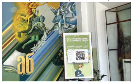
В Пето ОУ посрещат празника и с интересна образователна игра, посветена на техния патрон Митьо Станев

По случай отбелязването на 145 години от освобождението на България в НГПВМ "Иван Павлов"-Стара Загора в часовете по история ще бъде представена презентация, в клас учениците ще се включат и във викторина. Възпитаниците на професионалната гимна-