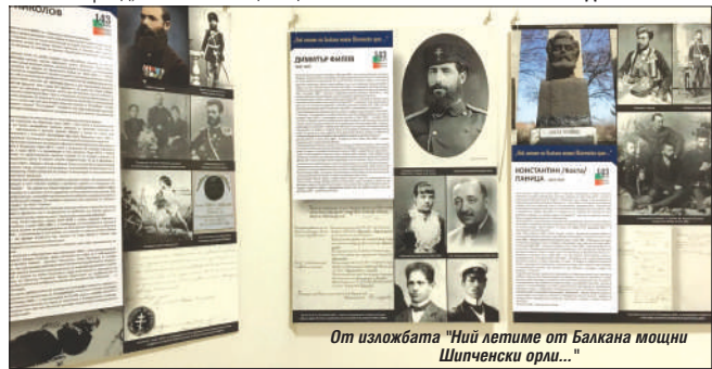
От изложбата "Ний летиме от Балкана мощни Шипченски орли..."