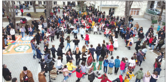
Миналогодишното празнично хоро в двора на училището

Празничните събития в училището продължават и след третомартенската седмица. На 28 март се навършват 155 години от рождението на Максим Горки. По този повод и по случай 60-ата ни годишнина Съюзът на писателите в Москва ни подари бюст-паметник на нашия патрон. За съжаление,